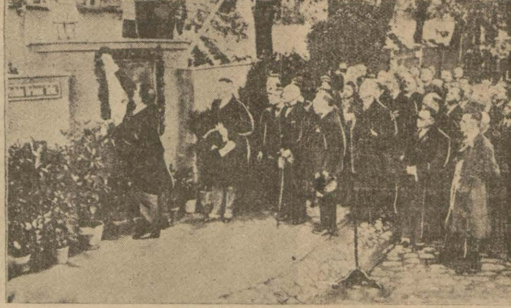
Son Rusyaya yaptığı seyahat esnasında Sabık Fransız Başvekili M. Heryo Fransaya avdet ederken Rigadan geçmiştir. Resmimiz M. Heryoyu Rigada bir "Briand," caddesi küşat ederken gösteriyor.

Roma 29 — Bir iki gündenbergi Romada bulunmakta olan Belçika Başvekili kont Brokvil Brüksele gitmiştir.