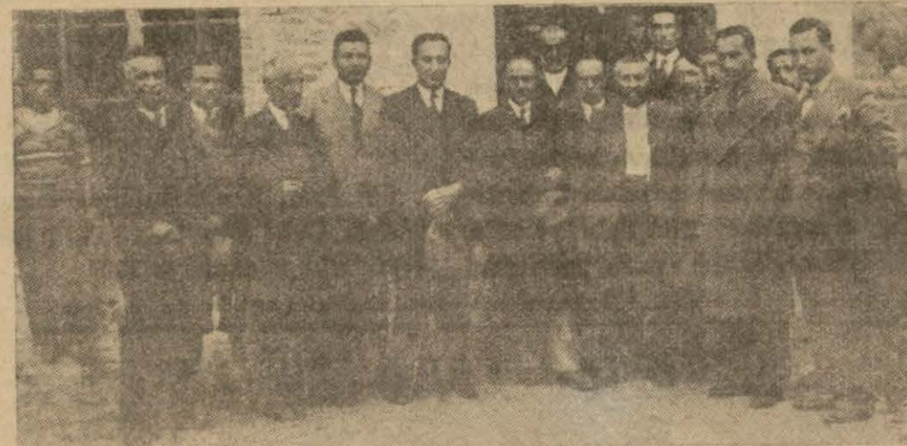
Kütahya vali ve Meb'usları Tavşanlı'da

Tavşanlı, (Hususi)—Kütahya valisi ve meb'usları kasabamıza gelerek tetkikatta bulunmuşlardır. Vali ve meb'uslarımız münadiler vasıtasile halkı davet ederek herkesle ayrı ayrı temas etmişler ve dileklerini, isteklerini sormuşlardır. Kasabanın Ortamektebe olan ihtiyacı şiddetle nazarıdikkati celbetmiş, bir mektep açılması için teşebbüsatta bulunması kararlaştırılmıştır.