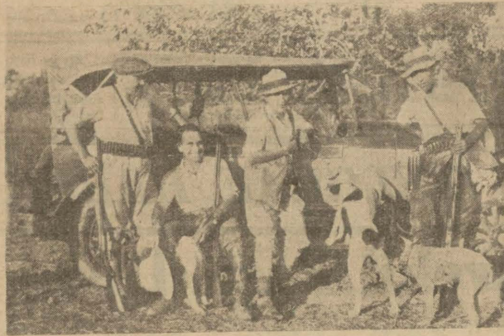
Turaç avına çıkmış bir grup

O kadar ki düştüğü zaman yarıldığı vakidir. Iskarası yapılırken bir mahalle öteden üveyiği kokusundan tanırsınız. Gelişleri de gariptir. Milyonlarcası birden gelir. Kuremler (sürüler) buca-