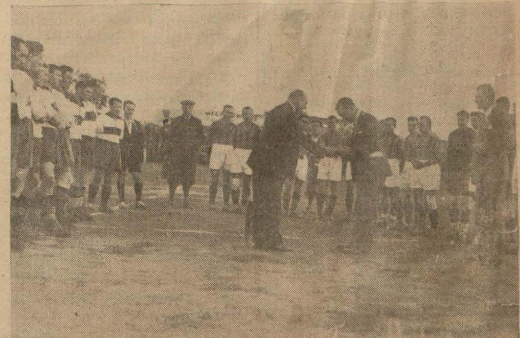
Dünkü müsabakadan başka bir intiba

Dün Vinersporla (0-0) berabere kalan Fenerbahçe takımı en muvaffakiyetli ve güzel oyunlarından birini oynamış ve çok şerefli bir beraberliği temin etmiş oldu.