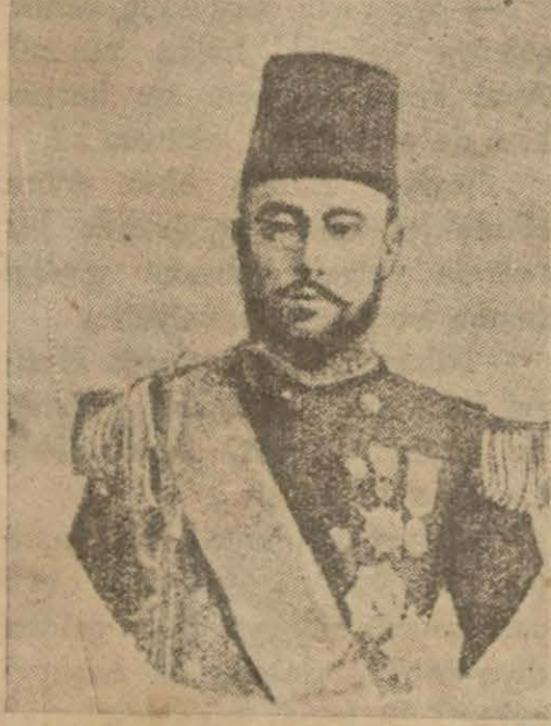
Bahriye nazırı Arif Hikmet Paşa

şayia, Abdülhamit üzerinde çok fena bir tesir husule getirmişti. Bu rivayete nazaran ordu ve donanmanın ittifakile Abdülhamit, saltanatından iskat edilecekti... Ortada hiçbir sebep olmadığı için evvelâ Abdülhamit bu şayialara ehemmiyet vermek istemedi. Fakat daha hâlâ saray muhitinde olan bir takım şuuruzlar, sıklıkla avcı taburlarının Yıldız civarına sokulmasını, donanmanın da deniz tarafından ayrılmasını ileri sürerek bu rivayetleri teyit edecek ve Abdülhamide büsbütün endişe verecek sözler çıkardılar. Abdülhamidin evhamını büsbütün arttırdılar.