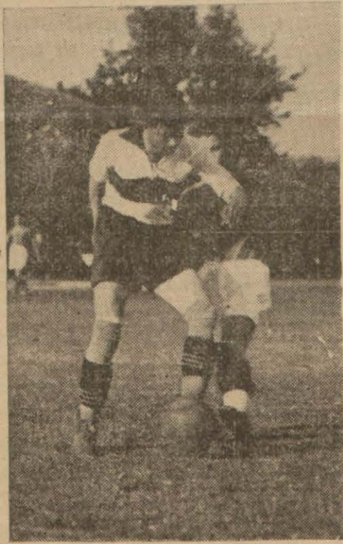
Maçtan bir enstantane

Oyunun otuz beşinci dakikalarda doğru hâkimiyet Avusturyalıları geçer gibi oldu. Avusturya merkez hafından çıkan üstadane bir ara pasını yakın mesafeden düzgün çeken Avusturya merkez muhaciminin şutunu çelen kaleci elinden kaçırdı. Yetişen sağ için üç metreden çektiği