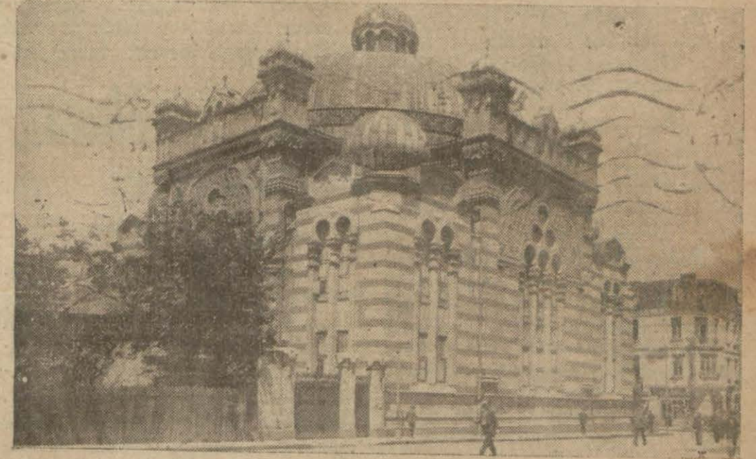
Sofyadan bir manzara: büyük kilise

diği şu kısa telgrafı buraya koyduktan sonra Sofyada çıkan “Pladne,, gazetesinde son nus-